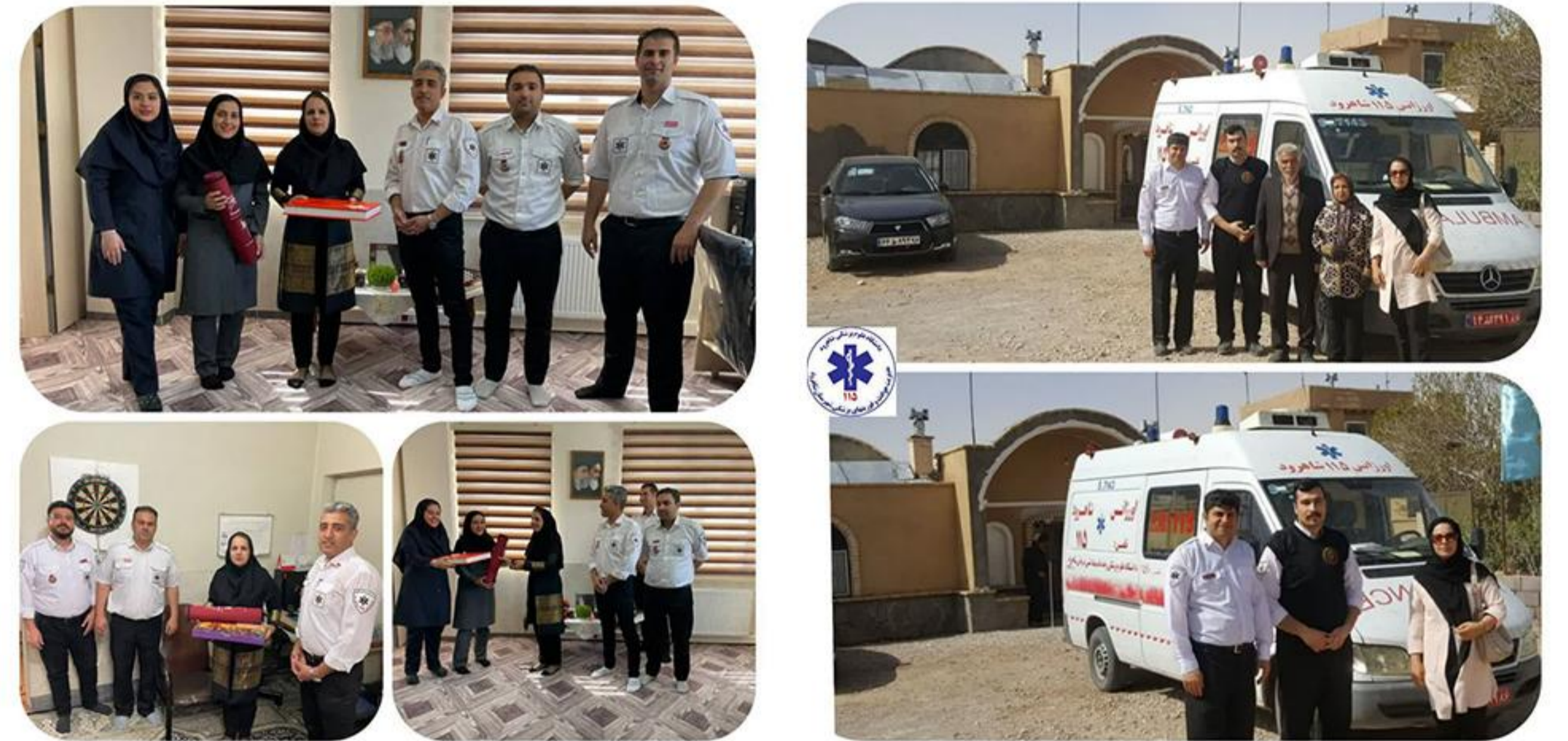
پایش نوروزی رییس اورژانس شاهرود از استقرار همکاران پایگاههای اورژانس

دکتر ناو آور با بیان اینکه این تعداد نوزاد متولد شده از ابتدای فروردین تا ظهر ۱۵ فروردین بوده است گفت: ۴۲ نوزاد دختر و ۵۳ نوزاد پسر بوده اند وی با اشاره به اینکه بیمارستان بهار شاهرود در بخش زنان و زایمان با امکانات مناسب برای مادران باردار خدمات زایمان را با حضور پزشک متخصص و ماماها با تجربه ارائه می کند افزود: در این مدت ۴۶ زایمان به صورت طبیعی و ۴۹ زایمان نیز سزارین گزارش شده است