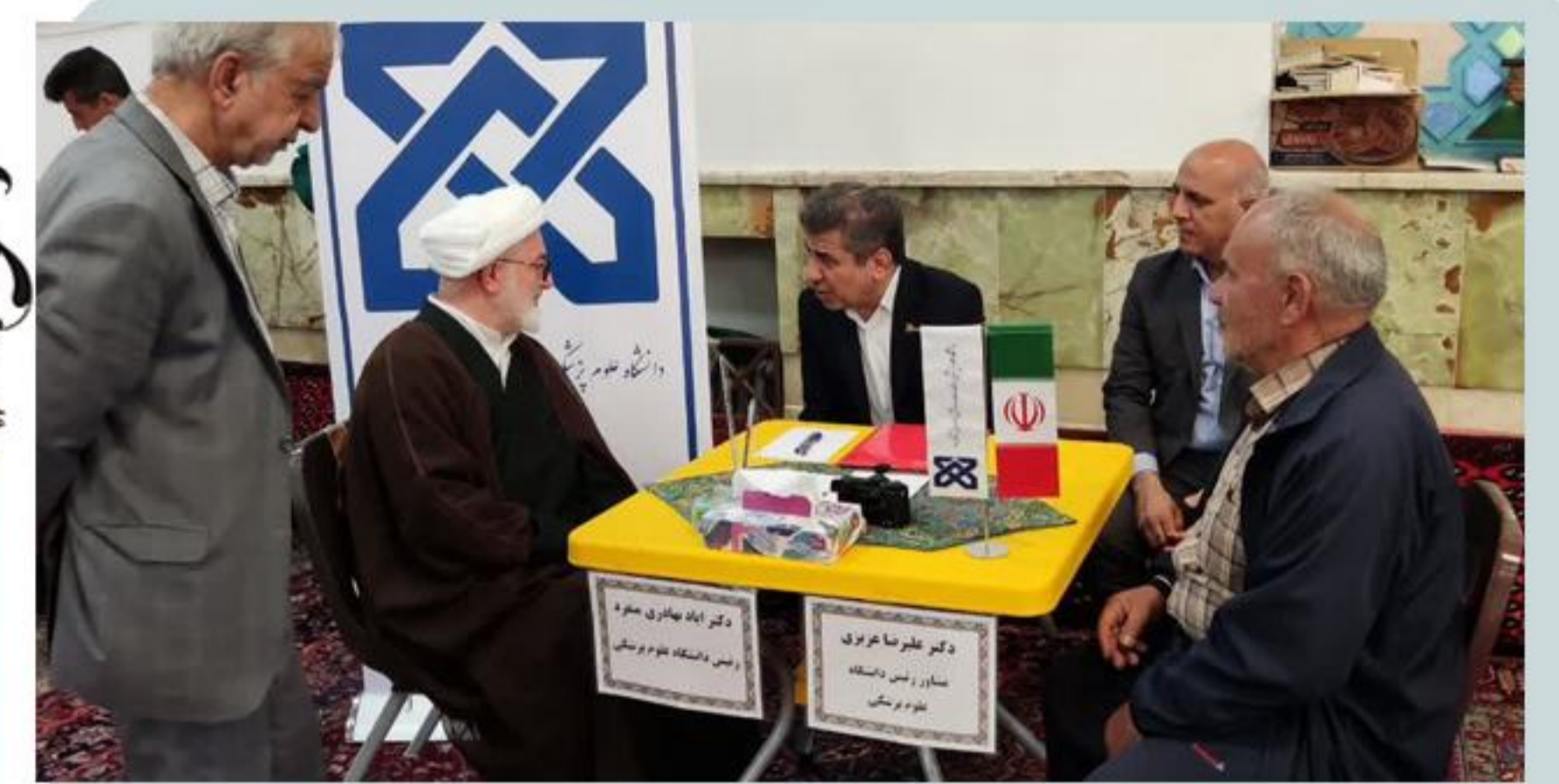
برپایی میز خدمت، با حضور رئیس دانشگاه علوم پزشکی شاهرود

توانمندیها و ظرفیت‌های دانشجویان و استفاده از فرصت شبکه‌سازی و تیم‌سازی دانشجویان مستعد از جمله اهداف طرح حامیم برشمرد.